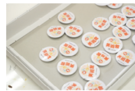
【新潟MOSごと美術館缶バッジ】

■U R L： https://cotocoto-museum.com/ https://www.mos.jp/oc/mosgoto/ （MOS ごと美術館）