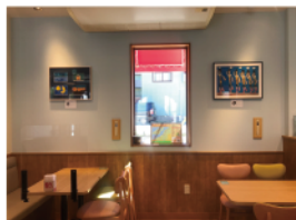
【過去のMOSごと美術館展示の様子】