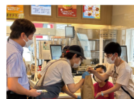
【新潟MOSごと美術館缶バッジ納品の日の様子】