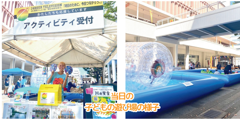
当日の子ども遊び場の様子

活動終了時には、ともに運営してくれた新潟ビジネス専門学校の学生に貢献書を授与させていただきました！学生達も達成感のある笑顔を見せてくれていました😊