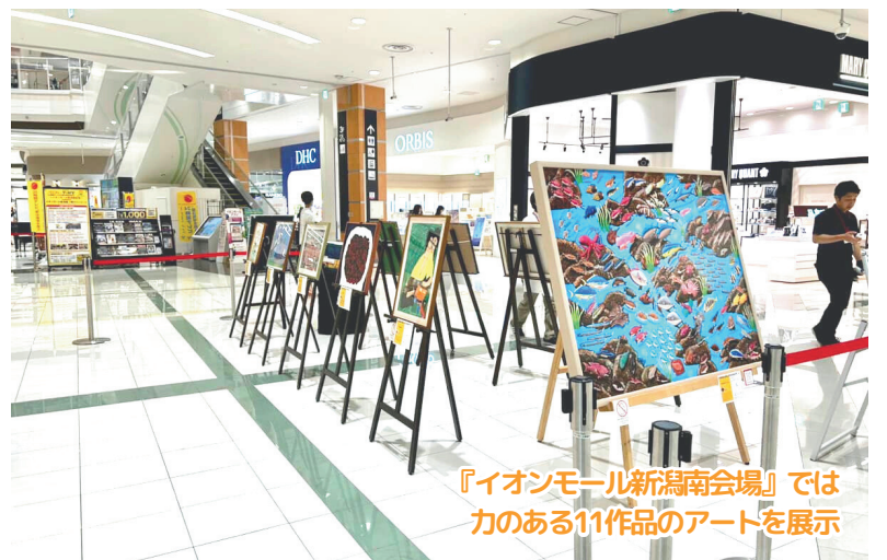
『イオンモール新潟南会場』では力のある11作品のアートを展示