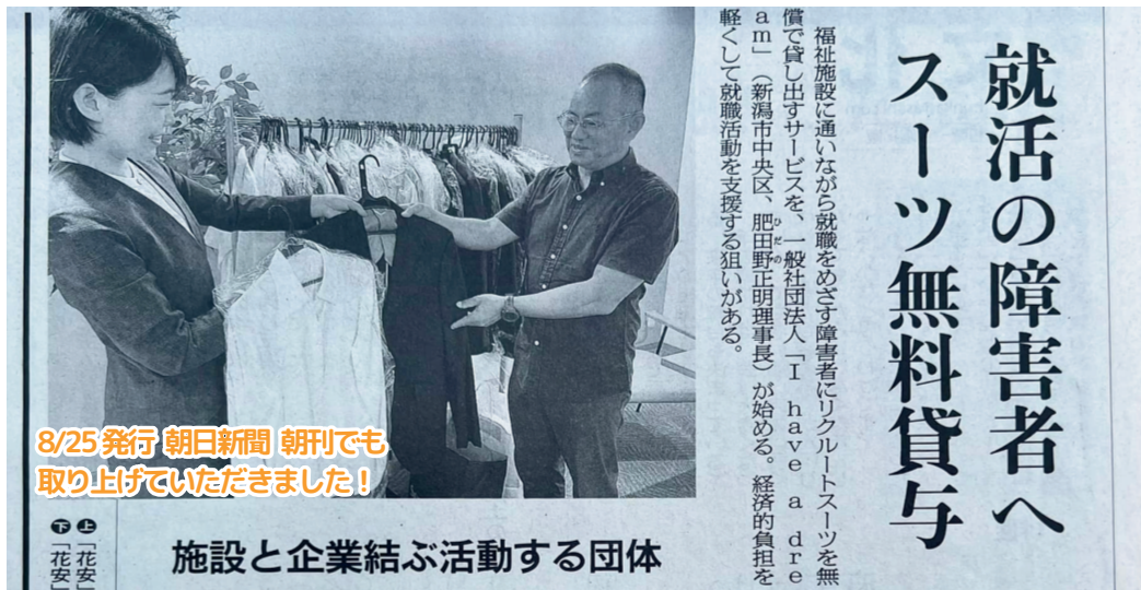
8/25発行 朝日新聞 朝刊でも 取り上げていただきました！