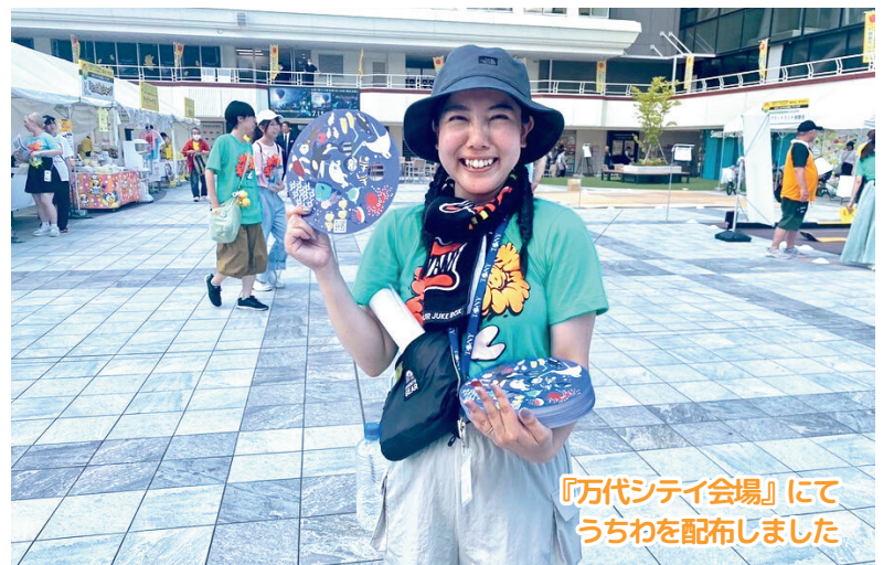
『万代シテイ会場』にてうちわを配布しました