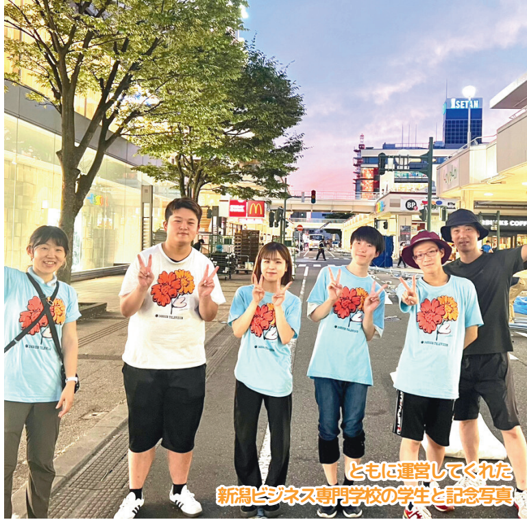
ともに運営してくれた新潟ビジネス専門学校の学生と記念写真