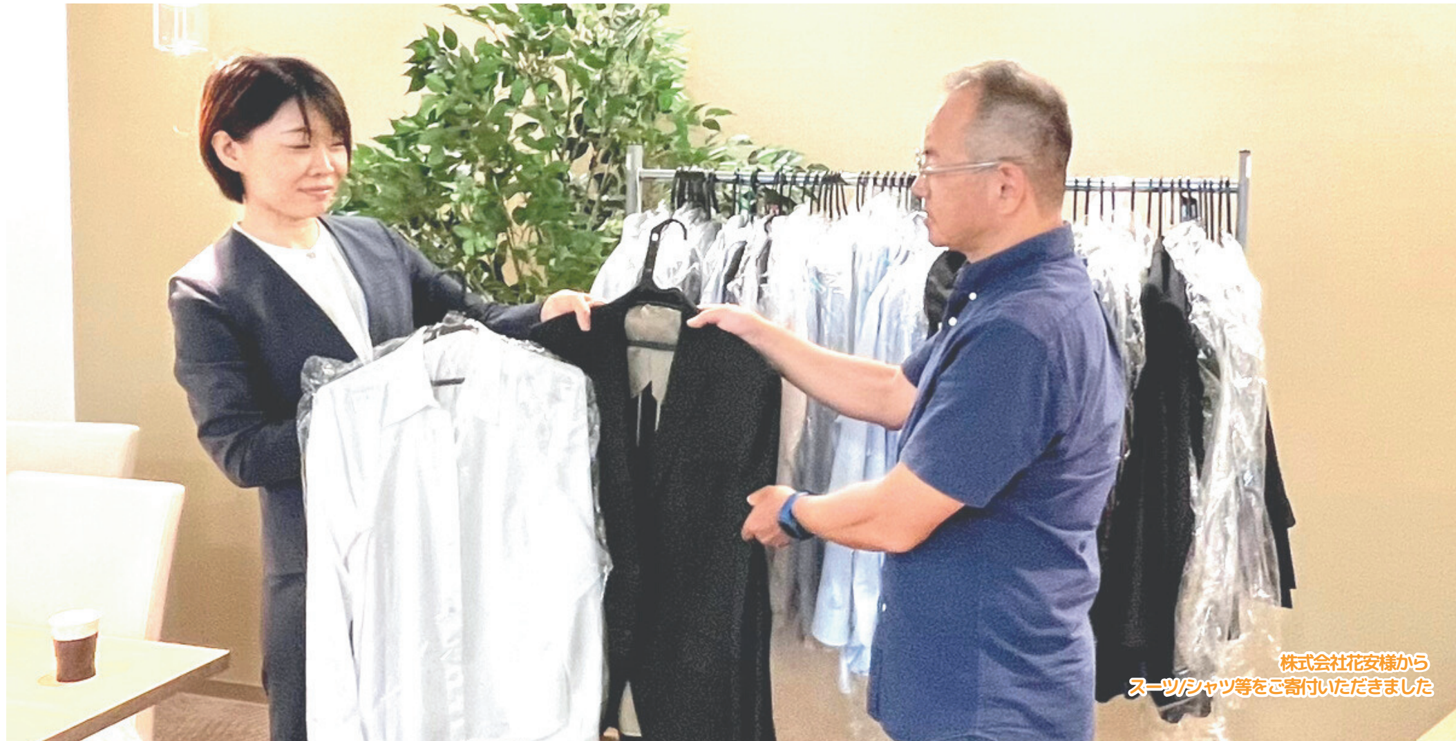
株式会社花安様から スーツ/シャツ等をご寄付いただきました