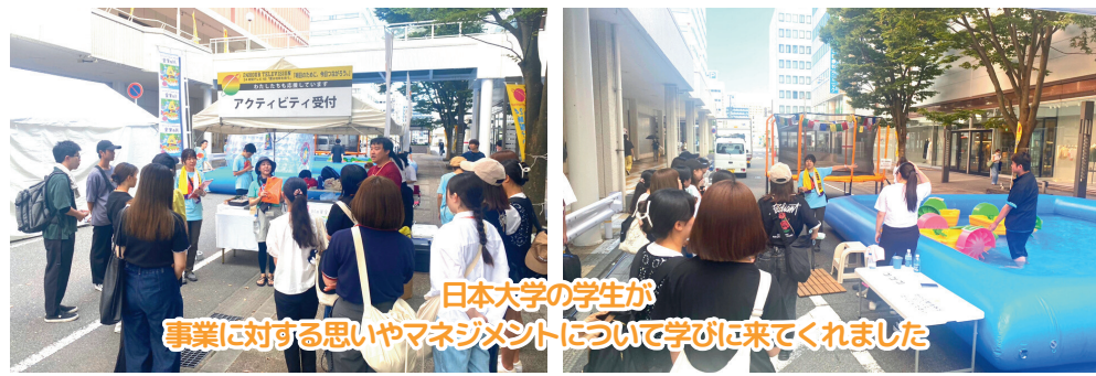
日本大学の学生が事業に対する思いやマネジメントについて学びに来てくれました