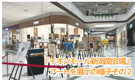
『イオンモール新潟南会場』アート展示の様子その2